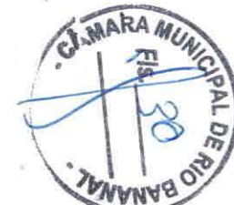
EDMILSON SANTO ELIZARIO PREFEITO MUNICIPAL